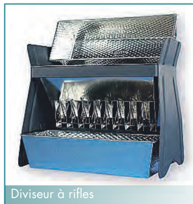
Diviseur à rifles

Par ailleurs, quelles que soient les précautions prises, il subsiste un risque d'erreur, appelée « erreur fondamentale d'échantillonnage ». A chaque étape du processus, tout doit être fait pour que sa valeur soit la plus faible possible et, en tout état de cause, très inférieure à la valeur mesurée. L'utilisation d'outils spécialisés (diviseurs à rifles, diviseurs rotatifs) y contribue. En effet, ils permettent de diviser un prélèvement en s'assurant que les différentes fractions obtenues sont aussi représentatives que l'échantillon d'origine.